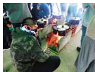
校外オリエンテーション

修学旅行 2年生の学年行事です。近年は、沖縄に3泊4日を実施、平和学習の他、グループ活動やマリンスポーツなどの自然体験も行っています。