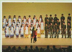
合唱祭(6月)森のホール21大ホール