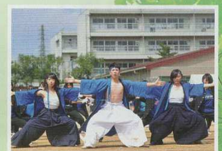
体育祭(9月)グラウンド