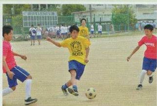
球技祭(5月)グラウンド・体育館等