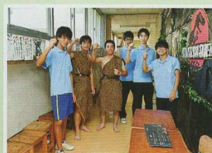
文化祭(9月)一般公開あり